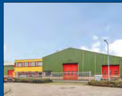
BLOKKER, Gildenweg 19

Huurprijs € 2.250,- per maand (excl. BTW)