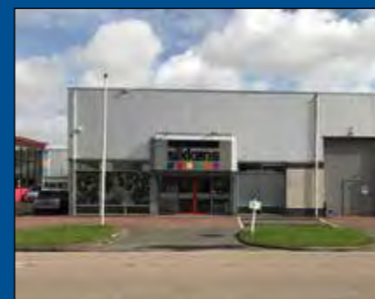
HOORN/ZWAAG, De Factorij 25B

Huurprijs € 1.400,- per maand (excl. BTW)