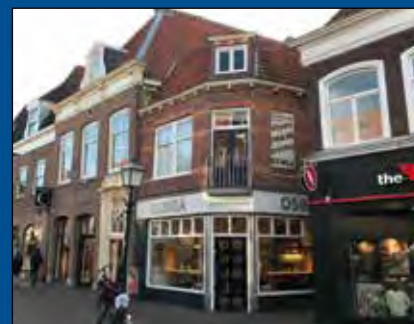
HOORN, Grote Noord 87

Als ondernemer spreekt u met een ondernemer & spreekt dezelfde taal.