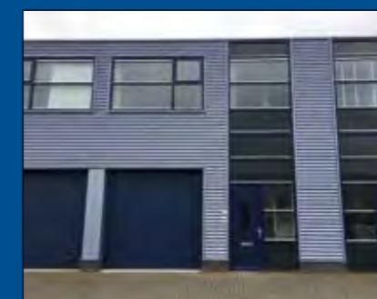
HOORN, Diodeweg 2C

Huurprijs € 65,- per m 2 /per jaar (excl. BTW)