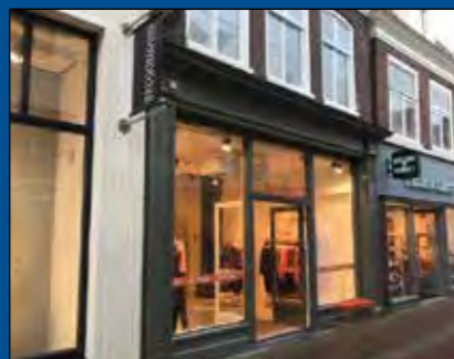
HOORN, Nieuwsteeg 20

Huurprijs € 2.500,- per maand (excl. BTW)