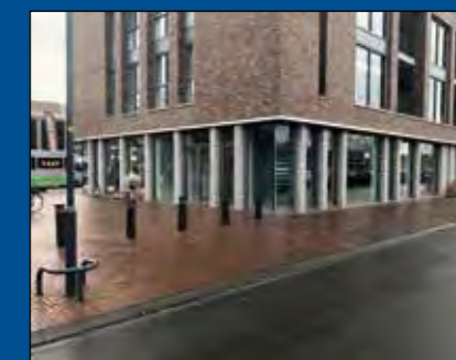
HOOGKARSPEL, Raadhuisplein 45

Splinternieuwe winkelruimte ter grootte van circa 100 m 2 BVO met een frontbreedte van circa 12 meter. De unit wordt casco opgeleverd en ligt vóór de entree van de drukbezochte Deen Supermarkten. De naastgelegen unit wordt ingevuld door een modezaak.