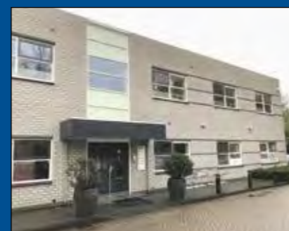
HOORN, Holenweg 14G

Huurprijs € 2.850,- per maand (excl. BTW)