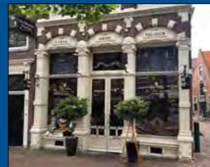
HOORN, Bred 38

Huurprijs vanaf € 675,- per maand (excl. BTW) Koopsom € 775.000,- k.k.