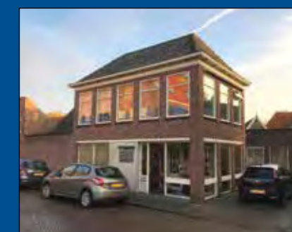
HOORN, Noorderstraat 46

Huurprijs € 1.585,- per maand (excl. BTW)