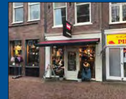
HOORN, Grote Noord 28

Karakteristiek winkelpand met historische gevel en sfeerol interieur ter grootte van circa 70 m 2 en circa 6 m 2 magazijn/toilet/pantry. Gesitueerd aan de bekendste winkelstraat van Hoorn. Het "Grote Noord" kenmerkt zich door de vele landelijke winkelketens gecombineerd met speciaalzaken en horeca. De winkel wordt turn-key opgeleverd voorzien van verwarming met heteluchtgordijn, rolluik, toilet, pantry en vloerafwerking.