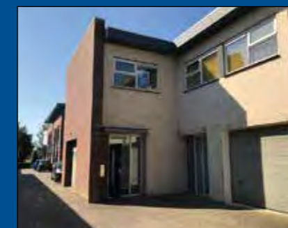
HOORN, Reaal 28A

Huurprijs € 2.450,- per maand (excl. BTW)