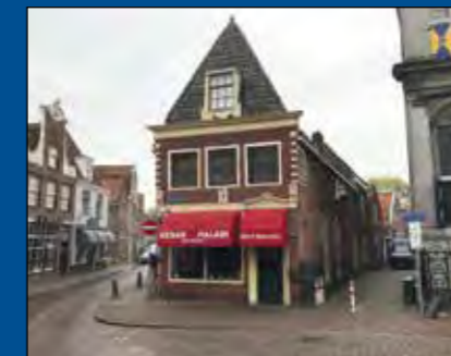
HOORN, Roode Steen 2

Huurprijs € 1.350,- per maand (excl. BTW)