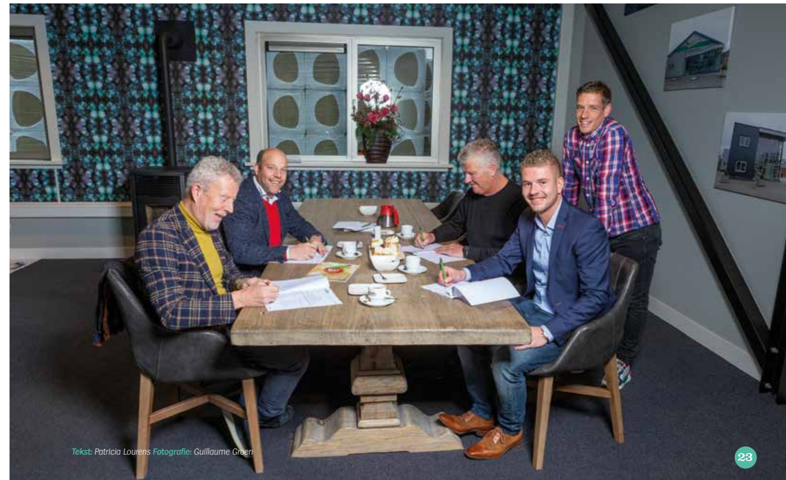
Tekst: Patricia Lourens