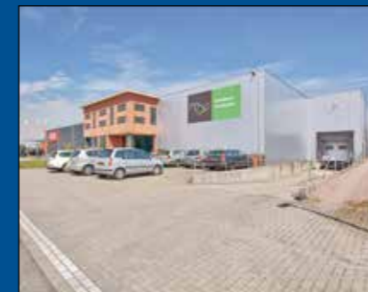
HOORN/ZWAAG - De Marowijne 43

Huurprijs € 1.350,- per maand (excl. BTW)