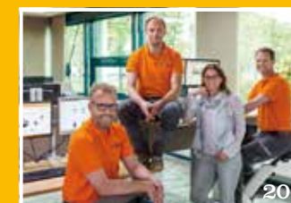
Flexicomfort laat West-Friezen staan