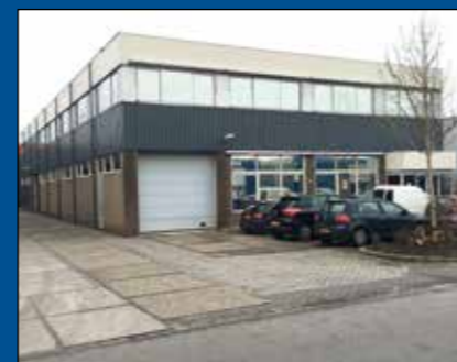
HOORN - Atoomweg 13

Multifunctionele representatieve kantoorruimte ter grootte van circa 285 m 2 , waarvan circa 100 m 2 op de begane grond en circa 185 m 2 op de eerste verdieping, gesitueerd op goed bereikbare locatie op bedrijventerrein "Hoom 80". Indeling: ruime hal met elektrisch bedienbare toegangsdeuren, twee kantoorruimtes, garderobe en toiletruimte. Op de eerste verdieping een ruime overloop met vide en vier royale kantoorruimtes en voldoende toiletgroepen.