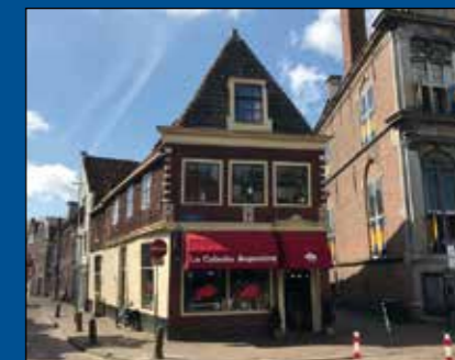
HOORN - Roode Steen 2

Op zichtlocatie gesitueerd monumentaal horecapand ter grootte van circa 140 m 2 in gebruik als restaurant, direct naast het Westfries Museum op het bekendste plein van Hoorn, te weten de Roode Steen. Zeer geschikt voor ondernemers die zich wensen te vestigen op een herkenbare en in het oog springende locatie. Het geheel wordt turn-key als restaurant opgeleverd.