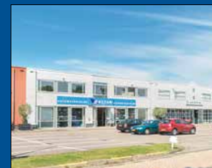
HOORN/ZWAAG - De Oude Veiling 22

Op zichtlocatie aan de rand van het bedrijventerrein gesitueerde showroomruimte, uitgevoerd in moderne architectuur. Oppervlakte circa 700 m 2 waarvan circa 500 m 2 op de begane grond en circa 200 m 2 op de eerste verdieping. De ruimte wordt opgeleverd voorzien van aluminium pui, twee toiletten, verwarming middels heaters en elektra voorzieningen. 12 parkeerplaatsen op eigen terrein.