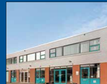
HOORN - Protonweg 14D

Huurprijs € 3.335,- per maand (excl. BTW) voor geheel Huurprijs € 2.750,- per maand (excl. BTW) voor alleen begane grond