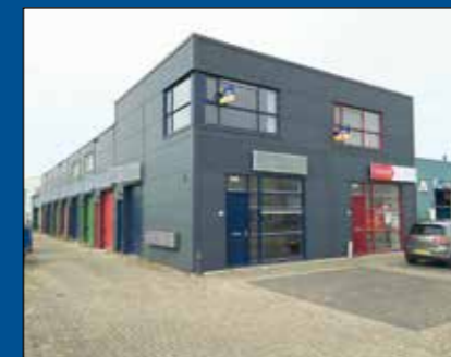
HOORN/ZWAAG - De Compagnie 52A

Huurprijs € 7.900,- per maand (excl. BTW) Koopsom € 1.195.000,- k.k. (excl. BTW)