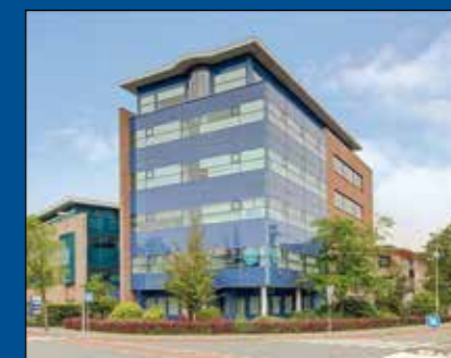
HOORN - Maelsonstraat 28 beggr

Huurprijs € 2.450,- per maand (excl. BTW)