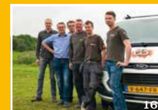
De persoonlijke touch van Beerepoot Installatietechniek