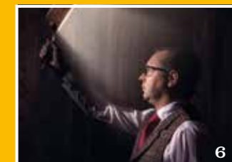
Coverstory: Storytelling in het Wapen van Medemblik

Het auteursrecht op de in dit tijdschrift verschenen artikelen wordt door de uitgever voorbehouden. Bedrijfsprofielen vallen buiten de verantwoordelijkheid van de redactiecommissie.