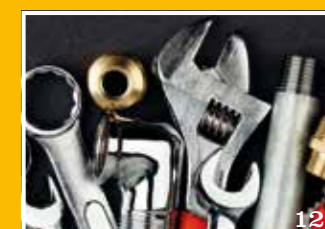
Thema: Het herstel van de installatiebranche zet zich voort