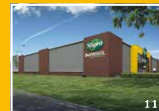
Sligro opent vestiging Purmerend