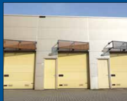
HOORN/ZWAAG - De Factorij 4H

Nette, representatieve bedrijfsunit onderdeel uitmakend van een kleinschalig bedrijfsverzamelgebouw welke in 2006 gerealiseerd is. Oppervlakte circa 80 m 2 verdeeld over de begane grond circa 55 m 2 bedrijfsruimte en eerste verdieping circa 25 m 2 kantoor-/kantineruimte. Het bedrijventerrein Westfrisia is gelegen nabij rijksweg A7. Op het terrein is parkmanagement actief.