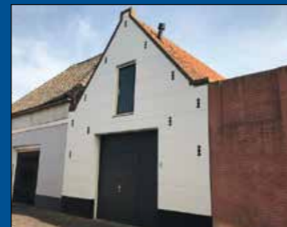
HOORN - Wijdsteeg 5

Geheel gerenoveerd pakhuis ter grootte van circa 95 m 2 , waarvan circa 55 m 2 op de begane grond en circa 40 m 2 op de eerste verdieping in de binnenstad van Hoorn. In 2006 is het pakhuis o.a. voorzien van nieuwe vloeren, systeemplafond, nieuwe elektrische voorzieningen en geïsoleerd. De overheaddeur is elektrisch bedienbaar en voorzien van een loopdeur.