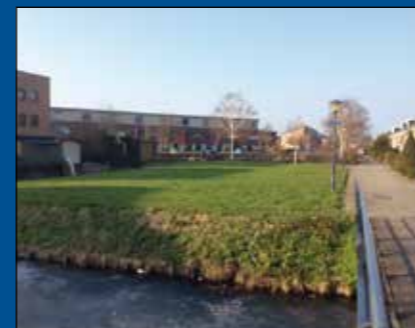
HOORN - Cezannehof ong.

Huurprijs € 595,- per maand (excl. BTW) Koopsom € 85.000,- k.k.