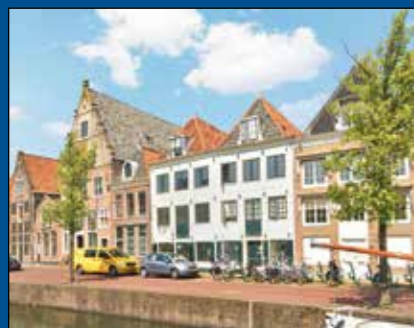
HOORN - Korenmarkt 5

Als ondernemer spreekt u met een ondernemer & spreekt dezelfde taal.