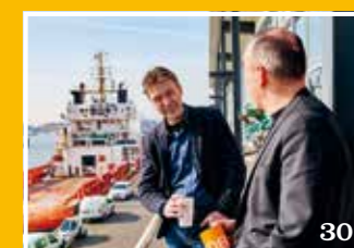
Rabobank over '100 dagen Trump'