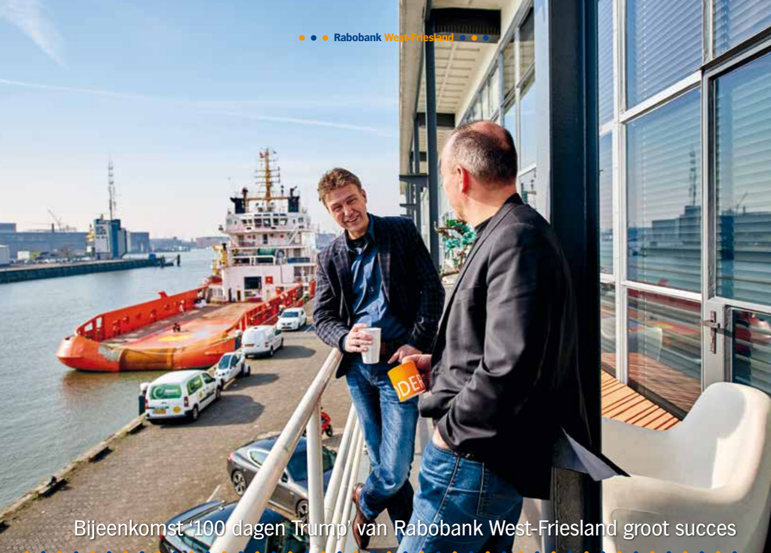
Bijeenkomst '100 dagen Trump' van Rabobank West-Friesland groot succes

'Voor dergelijke maatregelen heeft president Trump ruime bevoegdheden die het Congres in de afgelopen decennia heeft toebedeeld aan het Witte Huis. Executive orders over internationale handel kunnen daardoor ook grote gevolgen hebben voor Nederlandse ondernemers.'