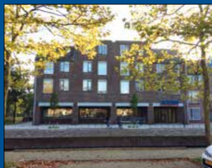
HOORN - Rondeelstraat 58

Huurprijs € 1.995,- per maand (excl. BTW)